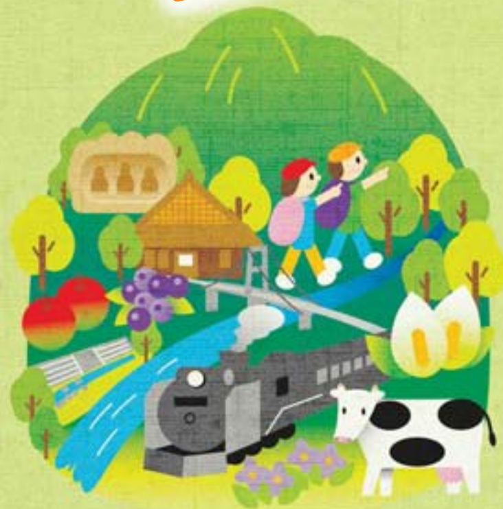
川場ののどかな風景のおすすめお散歩コース