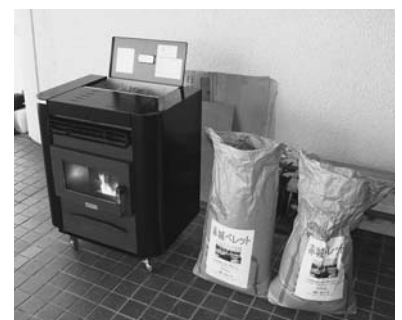
対象になるペレットストーブ