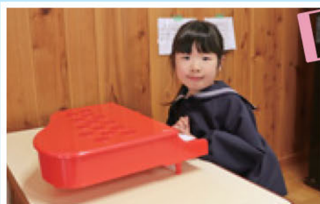
いしいりんちゃん