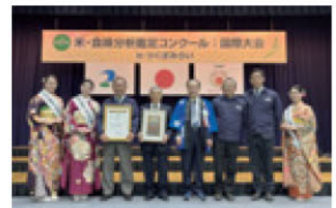
昨年度の大会の様子