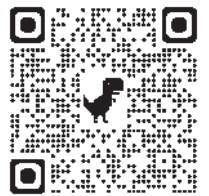
参加申込みQRコード