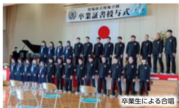
卒業生による合唱