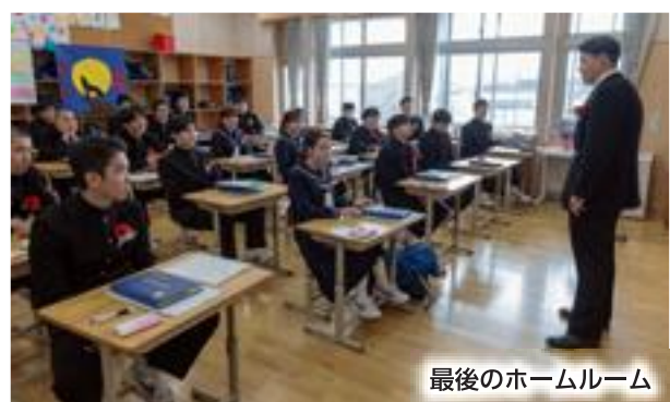
最後のホームルーム