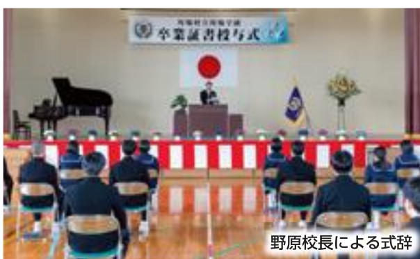
野原校長による式辞

4月からの新しい環境でも、川場学園の第1期生の誇りを胸に、自分らしく羽ばたくことを心から応援しています。