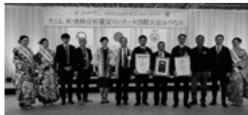
受賞おめでとうございます